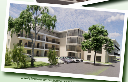
Visualisierungen zur Illustration. Änderungen vorbehalten